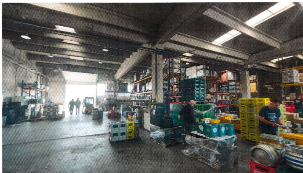
Slika 1: Dio proizvodno skladišnog prostora koji koristi tvrtka za veleprodaju alkoholnih i bezalkoholnih pića

Jedan dio hale (cca 400 m 2 ) koristi tvrtka koja se bavi veleprodajom bezalkoholnih i alkoholnih pića. Prostor je podijeljen fizičkim pregradama visine cca 2 m, te su u dijelu koji koristi tvrtka za veleprodaju alkoholnih i bezalkoholnih pića postavljene skladišne police (slika 1).