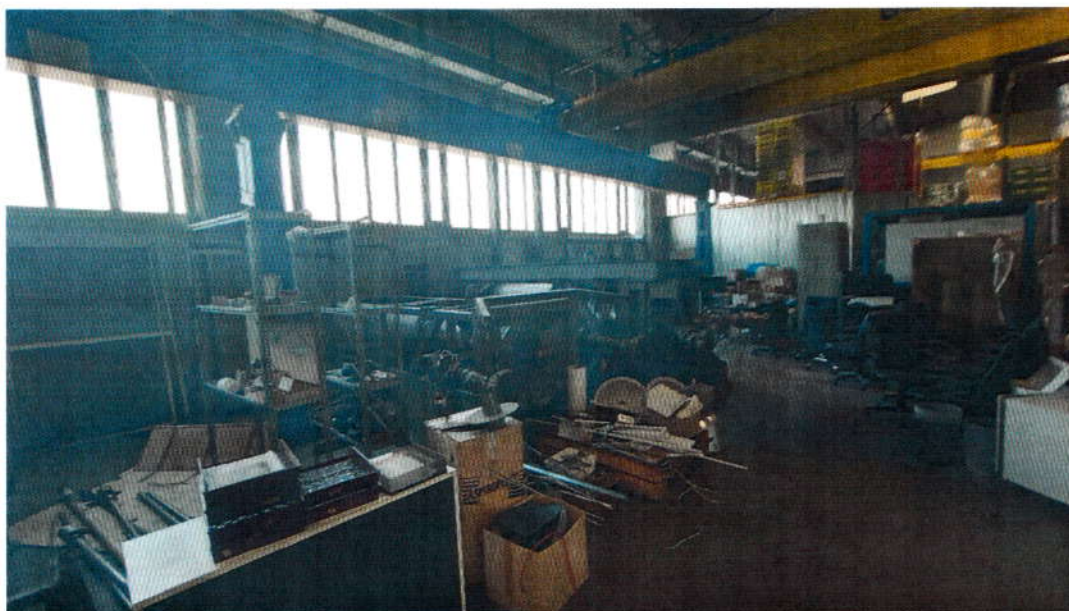
Slika 2: Dio proizvodno skladišnog prostora u kojemu se nalaze strojevi i oprema ALPRO-ATT u stečaju d.o.o.

U drugom dijelu proizvodno skladišne hale, koji je fizički odijeljeni od prvog dijela nalaze se strojevi za proizvodnju cijevi iz plastičnih masa tvrtke ALPRO-ATT u stečaju d.o.o.. Pregledom strojeva i opreme vidljivo je da je došlo do određenog pomjeranja pojedinih strojeva iz proizvodnih linija i cilju postizanja potrebnog prostora za skladište veleprodaje alkoholnih i bezalkoholnih pića. Isto tako došlo je do preinaka koji se odnose na uredske prostore u na način da su alatnica, skladište alata i laboratorij za ispitivanje materijala pretvoreni u urede za potrebe tvrtke koja se bavi veleprodajom alkoholnih i bezalkoholnih pića. Sva oprema iz preuređenih prostorija prebačena je u dio hale u kojemu se nalaze proizvodni strojevi i oprema.